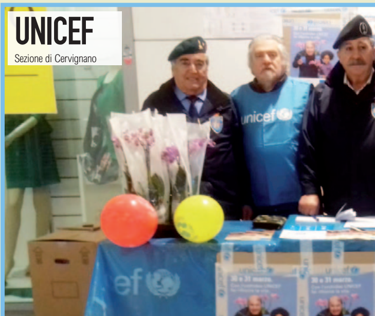
Sezione di Cervignano