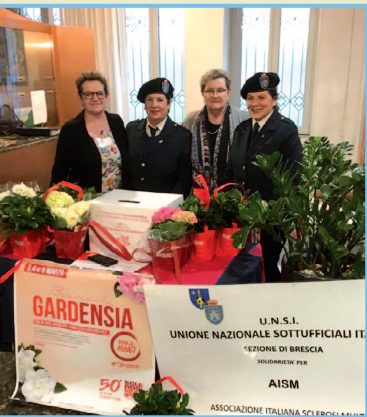
Le Dame di Brescia