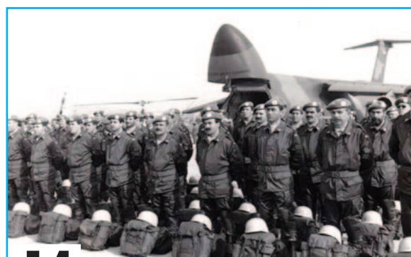
14 MISSIONE UNTAG-HELITALY IN NAMIBIA