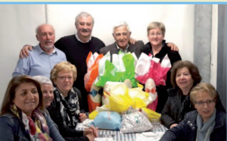
Le Dame di Valvasone