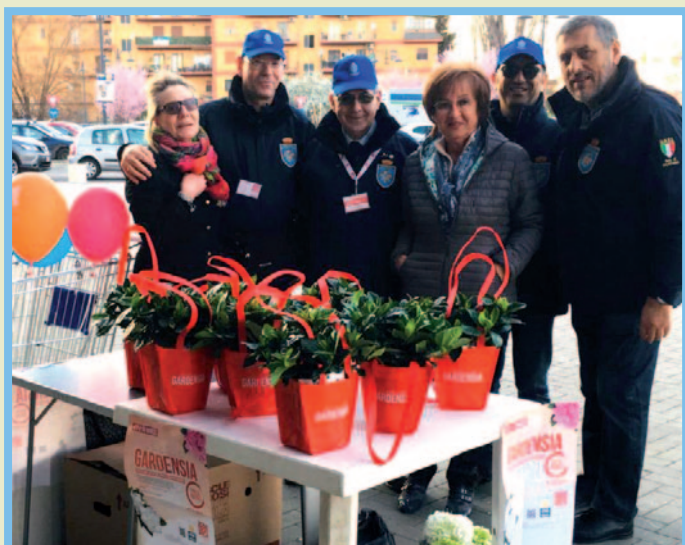
Sezione di Mentana