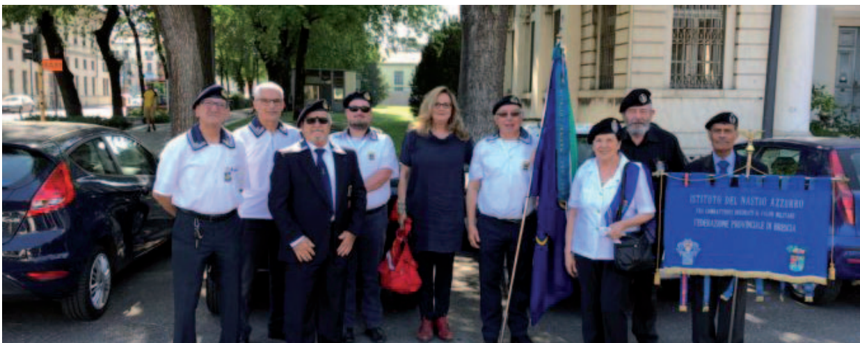
La rappresentanza della Sezione di Brescia.