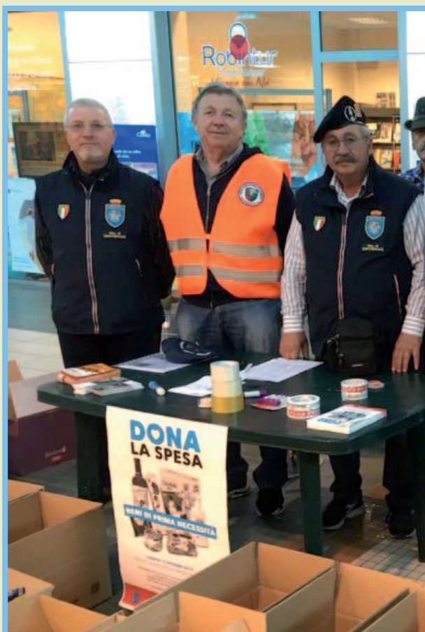
Sezione di Cervignano