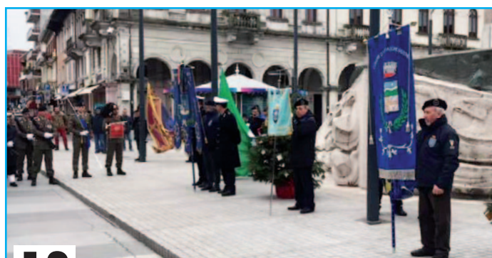
13 GIORNATA IN RICORDO DEI SOTTUFFICIALI CADUTI IN SERVIZIO