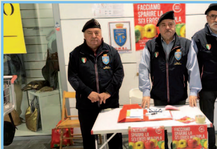
Sezione di Cervignano