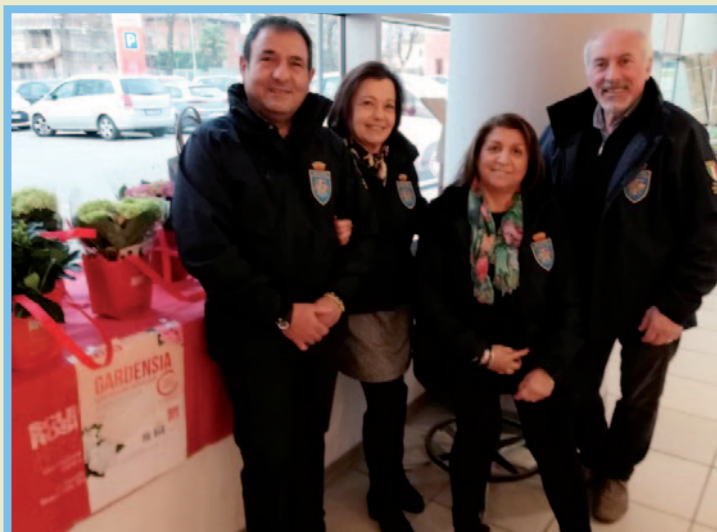
Sezione di Valvasone-Arzene