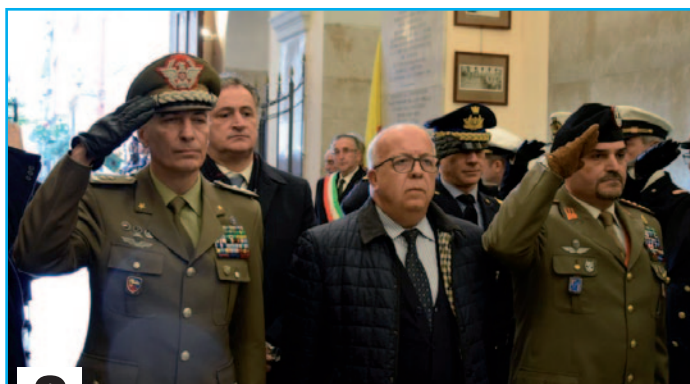
2 PROGETTO MILITE IGNOTO 2021

Numero Repertorio ROC: n°22803 del 20/09/2012