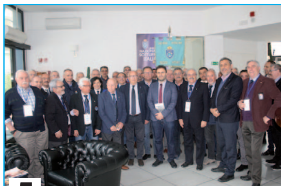
5 24° CONGRESSO NAZIONALE